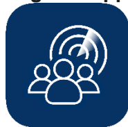
Abbildung des App Icons:

Bildmaterial (wird Ihnen auf Anfrage gerne hochauflösend zur Verfügung gestellt):